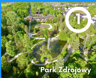
1 Park Zdrojowy