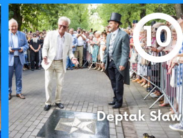
10 Deptak Sław

Sercem festiwalowego życia jest położona w Parku Zdrojowym Muszla koncertowa. Latem odbywają się tutaj występy, koncerty oraz konkursy. Do najpopularniejszych należą "Festiwal Operowo-Operetkowy" czy "Gala Polskich Tenorów". Unikalny charakter nadają jej specjalne iluminacje oraz zakopiańskie budownictwo.