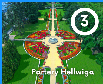
3 Partery Hellwiga

Budynek teatru powstał w 1891r. Został stworzony z myślą o rozrywek kuracjuszy i odwiedzających ich rodzin. Teatr cieszył się rosnącą publiką i już po 10 latach funkcjonowania został rozbudowany o balkon i 2 loże, a jego scena została poszerzona. Obecnie oprócz spektakli, odbywają się tu występy kabaretów.