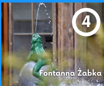
4 Fontanna Żabka

Miejsce nazwane na cześć autora - Zygmunta Hellwiga - architekta i ogrodnika. Ozdobione jest kobiercami kwiatowymi. Ciąg spacerowy istnieje od 1934r. Obecnie przyciąga kuracjuszy i turystów za sprawą Fontanny na Parterach Hellwiga, która cieszy widzów spektaklem wodno-świetlnym.