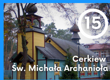
15 Cerkiew Sw. Michała Archanioła

Zegar słoneczny to bardzo specyficzny zegar, który odmierza czas na podstawie zmiany pozycji słońca, najczęściej wyrażony jako lokalny prawdziwy czas słoneczny. Zegar taki pozbawiony jest własnego napędu, jego działanie wykorzystuje obrotowy ruch Ziemi, co pozwala zaliczyć go do klasy zegarów naturalnych.