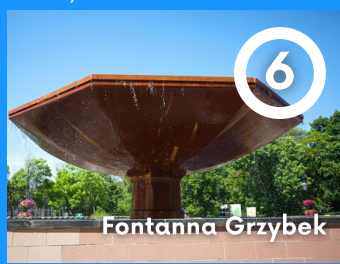
6 Fontanna Grzybek

To centrum reprezentacyjno-konferencyjne, które pozostaje w pełnej dyspozycji Prezydenta RP. Został wzniesiony na życzenia Prezydenta RP I. Mościckiego, w połowie lat trzydziestych XX w., lecz on sam nigdy go nie odwiedził. Obecnie znajduje się tam wystawa dotycząca roli prezydenta RP.