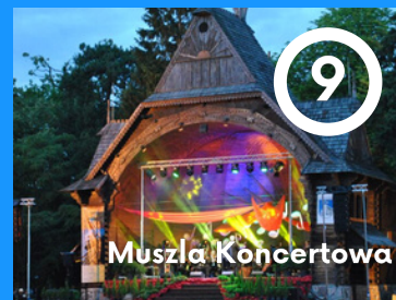
9 Muszla Koncertowa

Największa w Europie tego typu budowla drewniana. Najpopularniejsza atrakcja i symbol Ciechocinka. Dwie pierwsze teżnie budowano w latach 1824-1835, a trzecią w 1859r. Konstrukcje świerkowososnowe wypełnione są tarniną, po której sływa solanka o stężeniu 5,8%. Parując tworzy mikroklimat obfitujący w jod, sód, chlor, brom.