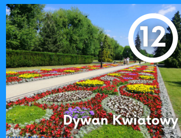
12 Dywan Kwiatowy

Fontanna powstała w 1927r. Wcześniej Fontanna Jaś i Małgosia znajdowała się w pobliżu Teatru Letniego, następnie została przeniesiona do centralnej części Parku Zdrojowego. Uznano bowiem, że zazieleniony teren parku będzie bardziej pasować do bajkowych postaci.