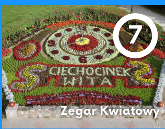
7 Zegar Kwiatowy

Znajduje w samym centrum miasta i stanowi symbol uzdrowisk działających w nim. Fontanna powstała w 1926r., zaprojektowana przez J. Raczynskiego. Jest elementem ciągu wykorzystywanego do produkcji soli. Jest ona zakończaniem głębokiego na 415 m. źródła (źródło nr 11), z którego solanka jest kierowana na pobliskie teżnie.