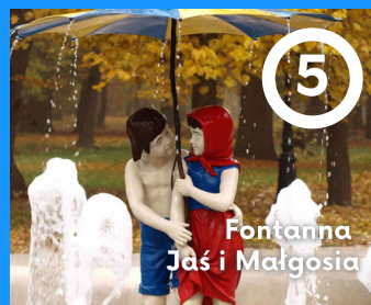
5 Fontanna Jaś i Małgosia

Fontanna z żabką zlokalizowana jest w Parku Zdrojowym, tuż obok Pijalni Wód Mineralnych. Niegdyś było to oczko wodne z kwiatami. Obecny wygląd fontanna zawdzięcza remontowi przeprowadzonemu w 2012 roku. Fontanna dodatkowo jest pięknie podświetlona nocą.