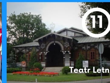
11 Teatr Letni

Deptak ten funkcjonuje od 5 lat, a odsłanianie na nim pamiątkowych tablic na stałe wpisało się w kalendarz wydarzeń plenerowych, organizowanych z udziałem znakomitości z dziedziny, filmu, muzyki, sportu i medycyny. Pierwszą osobą, która odsłoniła swoją gwiazdę był Zbigniew Boniek.