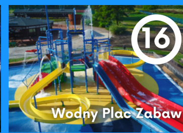
16 Wodny Plac Zabaw

Świątynia z 1894r. wzniesiona dla rosyjskich pacjentów oraz kuracjuszy wyznania prawosławnego, odwiedzających uzdrowiska w Ciechocinku. Budynek wykonany jest z drewnianych bali, bez użycia gwoździ. W okresie II WŚ w cerkwi mieściło się kasyno, co uratowało ją przed zniszczeniem.