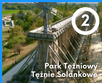
2 Park Teżniowy Teżnie Solankowe