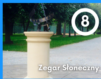
8 Zegar Słoneczny

Powstał w 1934r. Zaprojektował go Z. Hellwig (Partery Hellwiga) Wskazówki zegara porusza mechanizm ukryty w ziemi, natomiast tarcza zegara zmienia się wraz z porami roku. Do obsadzenia jej potrzeba niekiedy ok. 100 tys. sadzonek roślin i obsadzenie całej tarczy zajmuje fachowcom kilka dni.