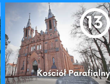
13 Kościół Parafialny

Przed dawnymi Łazienkami III każdego lata rozkwitają wielobarwne dywany kwiatowe. Fantazyjne wzory zmieniają się co roku. Do obsadzenia ciągu spacerowego zaprojektowanego przez Zygmunta Hellwiga używa się średnio ok. 120 tys. sadzonek roślin ozdobnych.