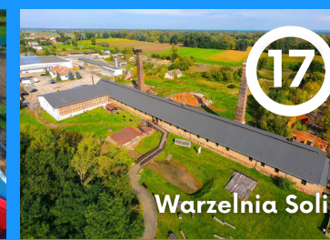
17 Warzelnia Soli

Plac zlokalizowany jest przy ulicy Staszica, tuż obok ciechocińskiego parku linowego i kortów tenisowych, w bezpośrednim sąsiedztwie najsłynniejszych w Europie teżni solankowych. O bezpieczeństwo na terenie obiektu dbają ratownicy WOPR*